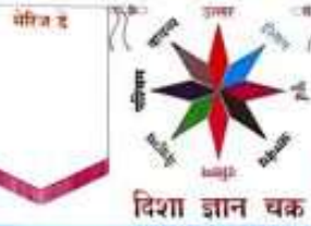
दिशा ज्ञान चक्र